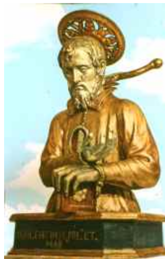
(san Valentino vecchio)