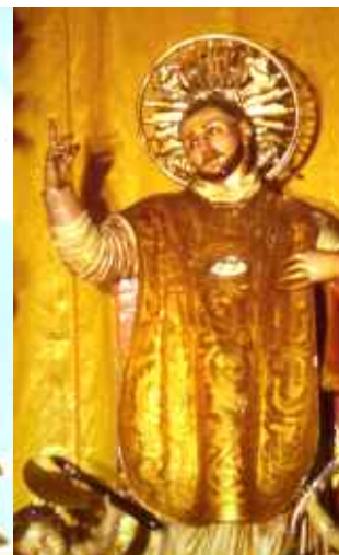
(san Valentino nuovo)

V ico non ha mai avuto come in questo periodo così tanti giovani che hanno conoscenze e capacità di alto spessore, che hanno fatto esperienza maturate nelle grandi città e che sanno padroneggiare mezzi tecnologici in grado di far circolare informazioni in maniera quasi istantanea e che rendono la vita più agevole.